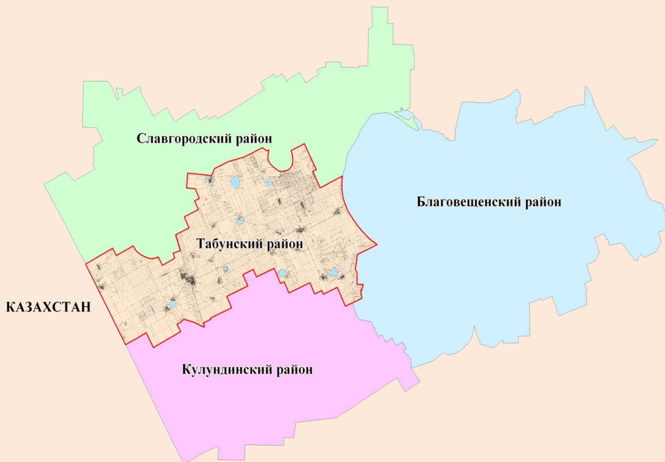
Рис.3 – Границы Табунского района

Население района составляет 7082 человек. В района 24 сельских населенных пункта, наиболее крупные из них – с. Табуны, с. Алтайское, с. Сереброполь, с. Большеромановка.